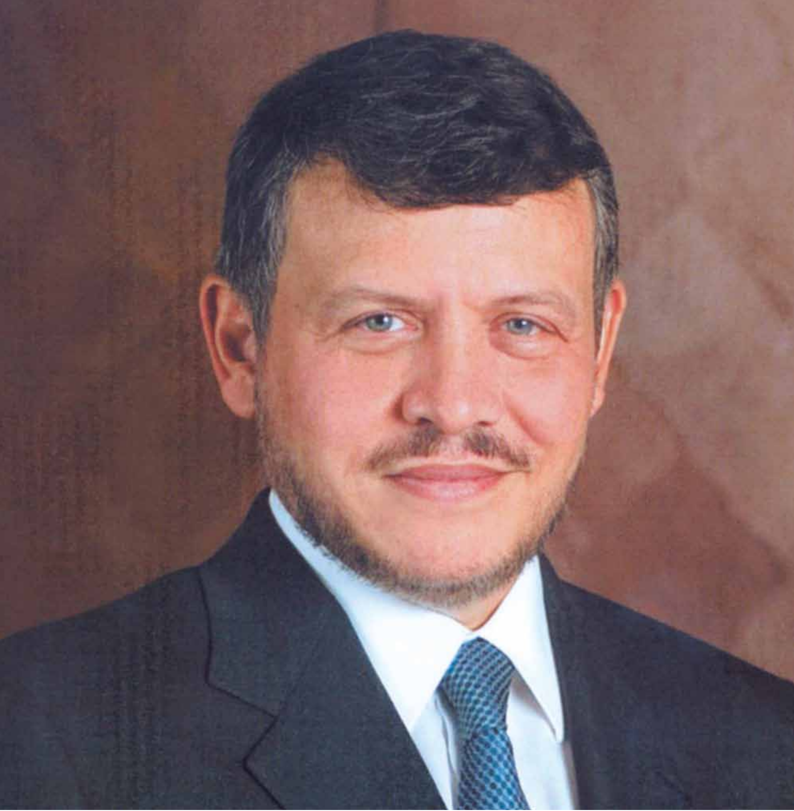
جلالة الملك عبدالله الثاني بن الحسين المعظم