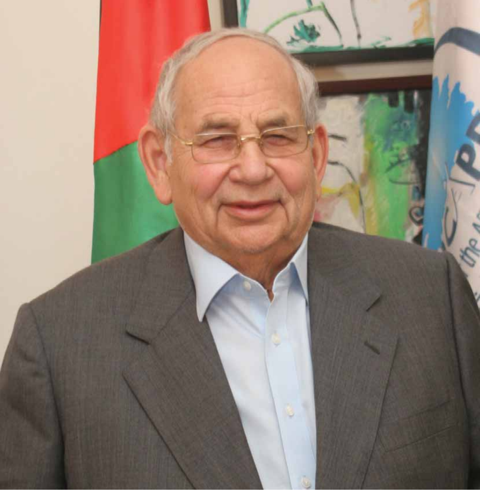
سمو الأمير رعد بن زيد رئيس المجلس الأعلى لشؤون الأشخاص المعوقين